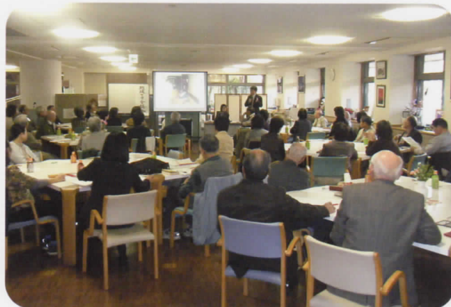
地元自治会、町内会、民生委員、老人会役員等関係機関による地域ケア会議

誰もが、この地域での暮らしに喜びを感じられるように。 お一人おひとりの声にできる限り耳を傾け、皆さまとともに地域ネットワークづくりを支援します。 どんなことでもお気軽にご相談ください。