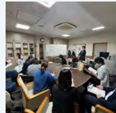
対策本部 本部立ち上げ訓練