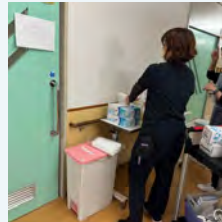
感染症対策実働 防護服等の準備