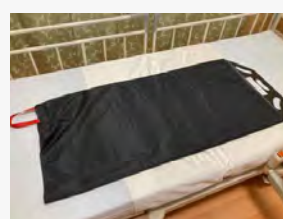
フレックスボード