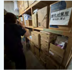
感染症対策物品 平時からの管理