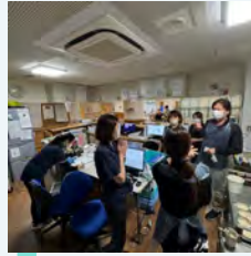
緊急事態発生 (BCP EMERGENCY)