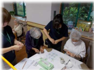
デイサービスでも。しかしなかなか難しく悪戦苦闘！

※「シトラスリボンプロジェクト」とは・・・コロナ禍で生まれた差別、偏見を耳にした愛媛の有志がつくったプロジェクトで、愛媛特産の柑橘にちなみ、シトラス色のリボンや専用ロゴを身につけて、「ただいま」「おかえり」の気持ちを表す活動を広めています。リボンやロゴで表現する3つの輪は、地域と家庭と職場(もしくは学校)です。