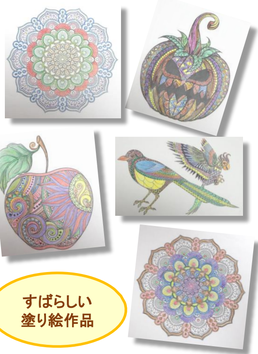
すばらしい塗り絵作品

日時：12月14日(火) 14:30～15:15 ※3年生は2クラスです。6時限目の授業を利用して交流します。