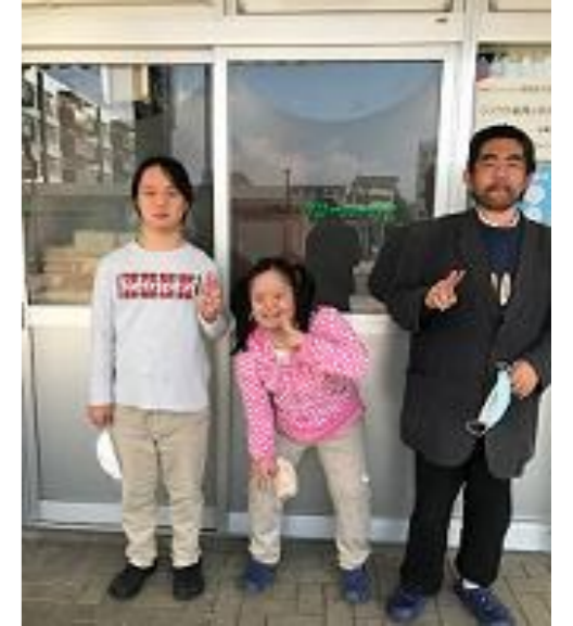
第二清風園の広報誌を配ってくださっている利用者のみなさんです。

その他の主な活動内容は「リサイクル品の販売」（福祉バザー）・「自主製品の製作と販売」（着物地を使った布草履・エコバッグ、織り機で作ったマフラー・コースターなどの製造販売）です。毎月、町田木曽団地名店街（本町田2570-4ハ-16-103）にて、福祉バザーを開催しています。詳しくはHP ( https://npo-clover-club.jimdofree.com/ ) をご覧ください。