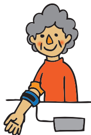
血圧・骨密度測定(無料)