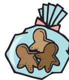
おこた会クッキー販売