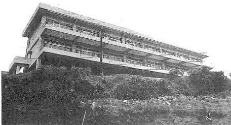
1964年開設した当時の清風園