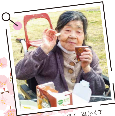
天気も良く、温かくて お花見日和になりました！

3月28日・30日の2日間にわたり、中庭で恒例のお花見を楽しみました！ 満開の桜の木の下で、ご利用者と職員と一緒に春のひとときを満喫。 春の訪れを全身で感じながら、笑顔あふれる特別な一日となりました。