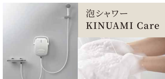
泡シャワー KINUAMI Care

泡シャワーという入浴支援機器を2月に導入しました。 消防車に使われている特殊な泡生成技術で、少量のソープと お湯、たくさんの空気を混合しきめ細かい泡を生成します。 その泡を体にかけて30秒後に流すだけできれいになるという ものです。「とてもさっぱりする」とご好評いただいています。