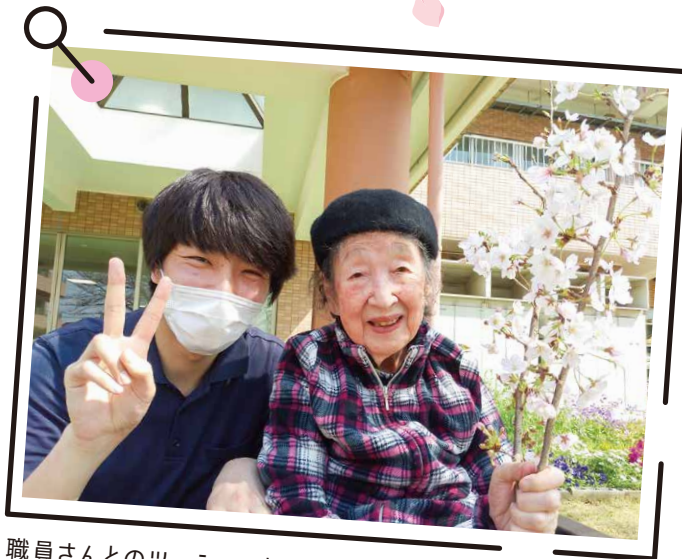
職員さんとのツーショット、二人とも素敵な笑顔です！