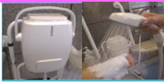
泡シャワー お肌に優しい絹泡で洗います