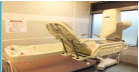
機械浴(寝台浴) 座位保持が難しい方