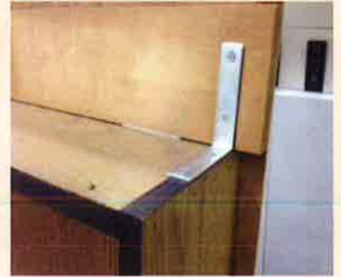
家具転倒防止器具の一例

高齢者がいる世帯や心身に障害のある方がいる世帯に対して、家具の転倒防止器具やガラス飛散防止フィルムの取付けを行い、工事費を助成しています。家具転倒防止器具は14,500円まで、ガラス飛散防止フィルムは17,500円までであれば、区負担のみで、無料で取付けが可能です。