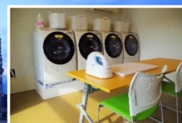
共用のランドリースペース