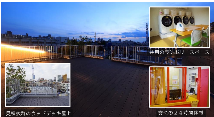
見晴抜群のウッドデッキ屋上