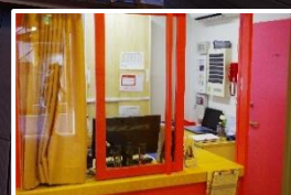
安心の 24 時間体制