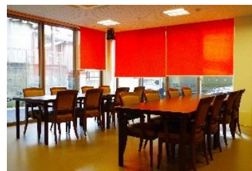
明るく開放的な食堂