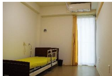
エアコン、ベッド完備の居室