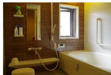
清潔感のある共用浴室