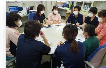
多職種による話し合い

利用者の意思を最大限に尊重し、ご本人らしい人生の終末期にふさわしいケアを多職種で行います。