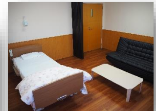
付き添いの為の個室

時間経過や症状変化に伴い、本人・家族の思いが揺れ動いた場合にも、いつでも思いを伝えられるように常にコミュニケーションがとれるようにしています。