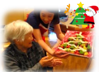
季節を感じる行事やお出かけも実施しています

お一人おひとりの体調や身体状態、趣味や嗜好、ケアマネジャーの立案したケアプランに沿ったプログラムを実施します